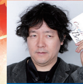
脳科学者 茂木 健一郎 氏